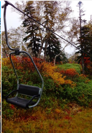
②ペアリフト乗車中