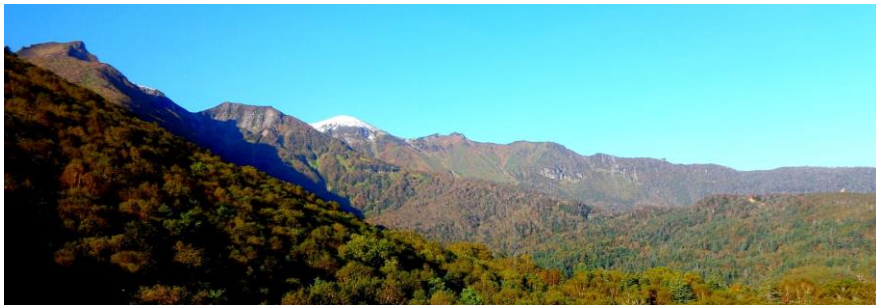
ロープウェイ乗車中:ロープウェイ下色付きが始まってきた

【紅葉進捗状態】 現在黒岳五合目まで色付き進む。落葉も目立ち始めてきたが、リフト乗車時は見頃継続。ロープウェイ下はまだ見頃まで数日かかりそう。黒岳東斜面は、全体的には落葉してきたが、点々とウラジロナナカマドが色付きを保っている。七合目周辺から頂上までは、16日以降の降雪の影響もあり、相当な悪路。運動靴程度では上山は厳しい。山頂から旭岳方面は完全な冬山となっている。本日は、いきなりの雨、風、雷、みぞれ。この時期は天候の急変に要注意。