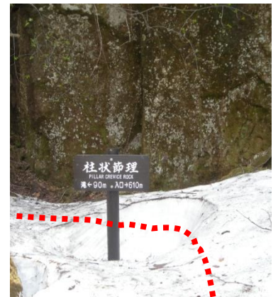
吹き溜まりの残雪