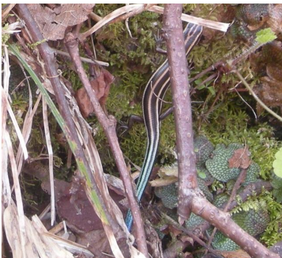
ニホントカゲの幼体：じっと動かずに身を隠している