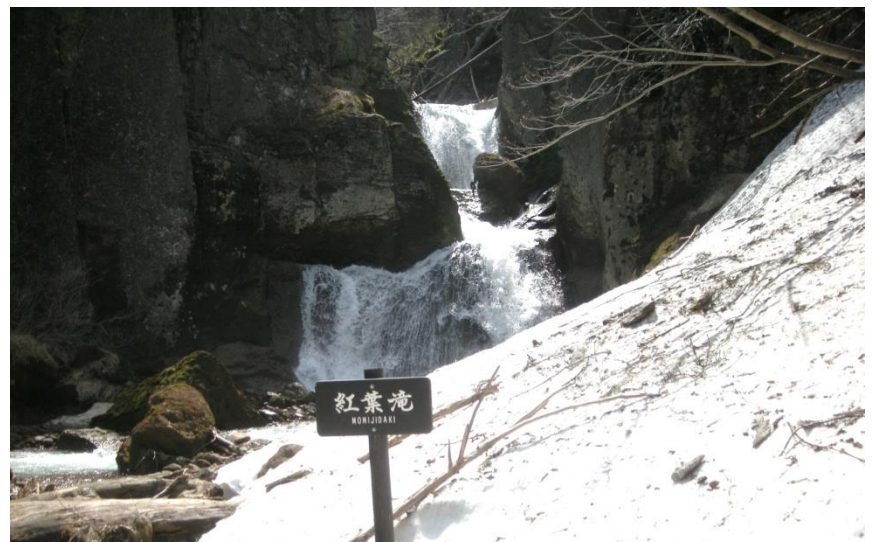
紅葉滝：滝の前は多くの雪が残っています