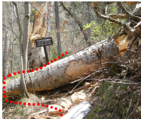
倒木：左側へ回り込んでください