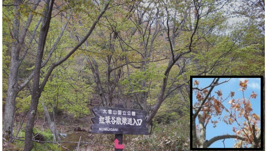
入口付近:新緑の季節を迎えました

赤石川の両岸は柱状節理となっており、野鳥の声を聞きながら新緑の森を散策できます。花の数も増えてきました。この芽生えの時期、カエデ類は色々の個性を発揮します。特に入口付近のアカイトヤの葉は赤く染まり、よく目立っていました。