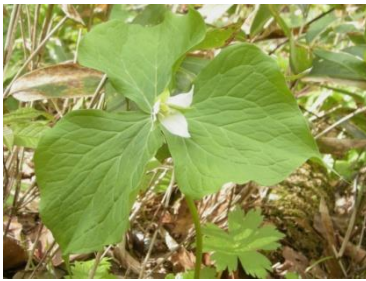
ミヤマエンレイソウ