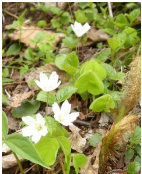
コミヤマカタバミ