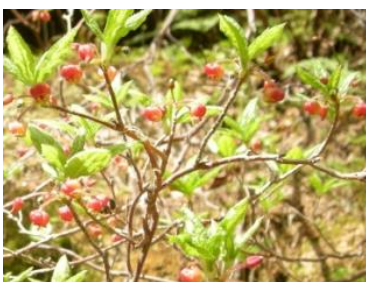
コヨウラクツツジ