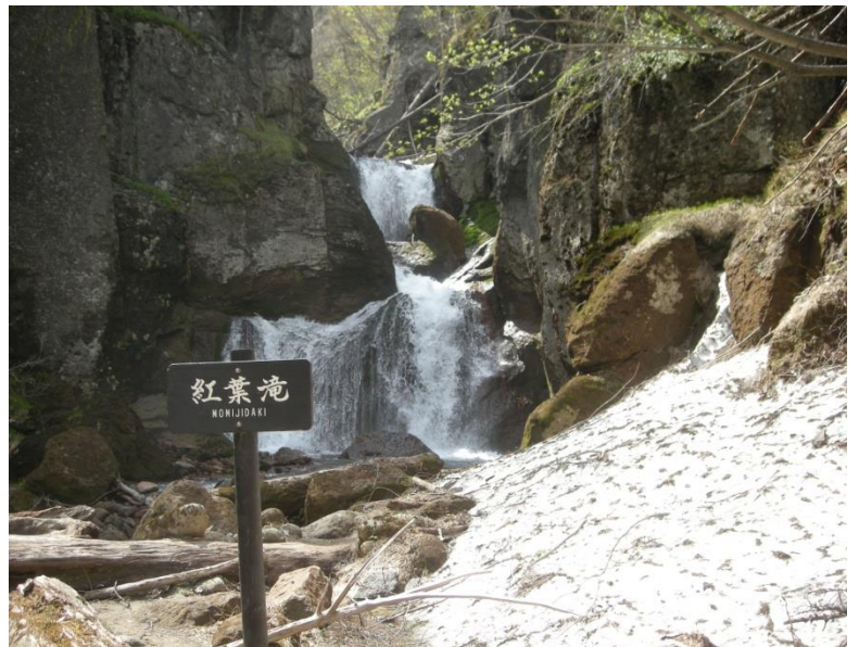
紅葉滝:雪が少し残っています