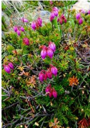
エゾノツガザクラ

【残雪状況】七合目～八合目部分的に登山道露出も七合標柱前 5m・標柱後 15・3・18・2・4・2・2・1・2・21m