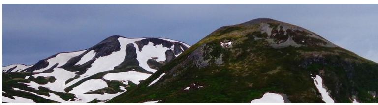
北鎮岳: 白鳥の雪渓も形作られてきました

【残雪状況】随分と雪どけが進みました。七合目標柱後 1・1m、八合標柱後 1・3・4mと短い雪渓。この後、お鉢平展望台手前まで消雪。【七合目～雲ノ平開花状況】前回情報時(6/27)に加えて新たにカラマツソウ・チシマキンレイカ開花。黒岳北東斜面～雲ノ平間、高山植物の開花が昨年比約一週間強の遅れ。4月の高温で雪どけは早いですが、5・6月の低温・降雪の影響で開花に影響が出ている。赤石川方面は、目立っているものはキバナジャクナゲのみ。尚、赤石川方面は至るまで消雪しているが、雪どけとともに登山道はかなりの悪路となっている。転倒要注意。