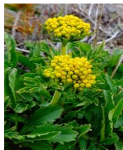
チシマキンレイカ