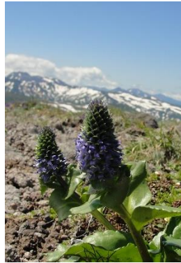
ホソバウルップソウ