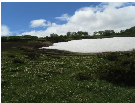
②第一花畑のチングルマ