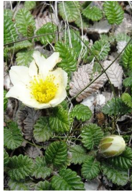
チョウノスケソウ