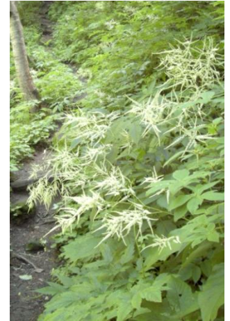
ヤマブキシヨウマ