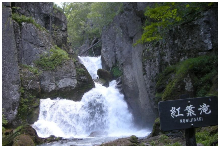
紅葉滝：雪解けの影響で水量が多くなっています