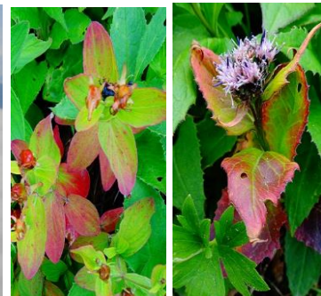
ハイオトギリ ナガバキタアザミ

【開花状況】【七合目～頂上】 エゾウサギギク↓・ヤマハハコ・コモチミミコウモリ・ミヤマアキノキリンソウ・ウメバチソウ↑・ハクサンボウフウ・ダイセツトリカブト↑・コマクサ・イワブクロ・ハイオトギリ↓・ナガバキタアザミ・イワギキョウ・ミヤマホツツジ等 【ポン黒岳～雲ノ平】 サマニヨモギ・シロサマニヨモギ・ヒメイワタデ・ミヤマリンドウ↑等 【赤石川方面】 ミヤマアキノキリンソウ・ミヤマリンドウ・アオノツガザクラ・エゾコザクラ等