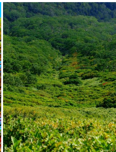
③黒岳九合目マネキ岩下部沢筋