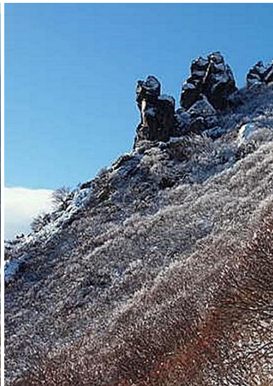
③黒岳九合目マネキ岩