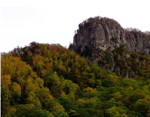
④ロープウェイ周辺 映月峰