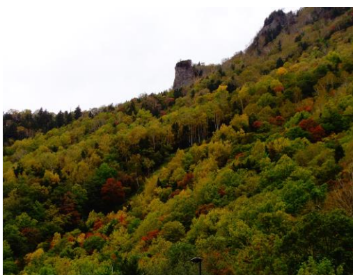
⑦銀河流星の滝周辺