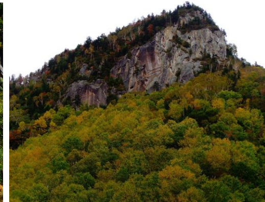
⑥銀河流星の滝周辺