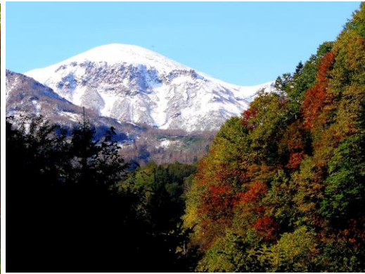
③ロープウェイ周辺 凌雲岳