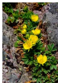
メアカンキンバイ