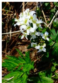
エゾイワハタザオ