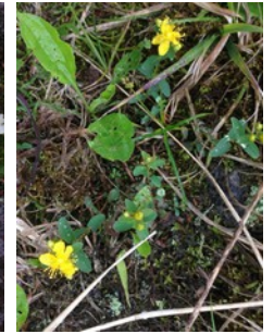
ホソバウルップソウ エゾノハクサンイチゲ イワウメ ダイセツヒナオトギリ