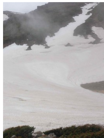
⑦白雲小屋テント場