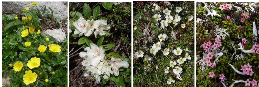
ミヤマキンバイ キバナシャクナゲ イワウメ ミネズオウ