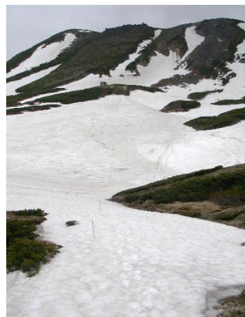
⑧ 板垣新道～白雲岳避難小屋

第3雪渓～第4雪渓の雪面は固く、足跡も不明瞭だったので視界不良時は注意が必要。小泉平周辺では、ミネズオウ、エゾコザクラ、エゾオヤマノエンドウなどが咲き始めていたが、ホソバウルップ草などは全体的につぼみの株が多い。白雲岳避難小屋周辺では、水場の確保はできていたがテント場は全面雪の為、幕営の際は雪の上に張ることになる。板垣新道の雪渓上には、ロープ等の目印があり、避難小屋まで迷わずに行けるようになっているが、視界不良時はハイマツ帯の出入り口が見つけづらいので注意が必要。花の沢周辺のロープ等も張られているがここも注意が必要。