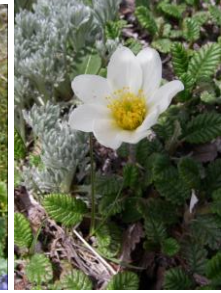
チョウノスケソウ