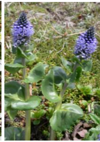
ホソバウルップ草