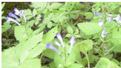
エゾタツナミソウ