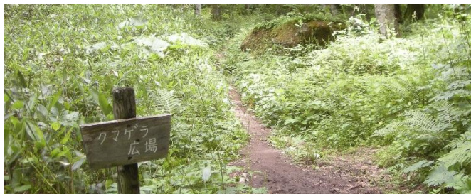
森の中は涼しく風がさわやかです