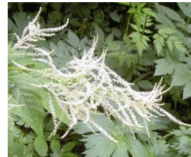
ヤマブキショウマ