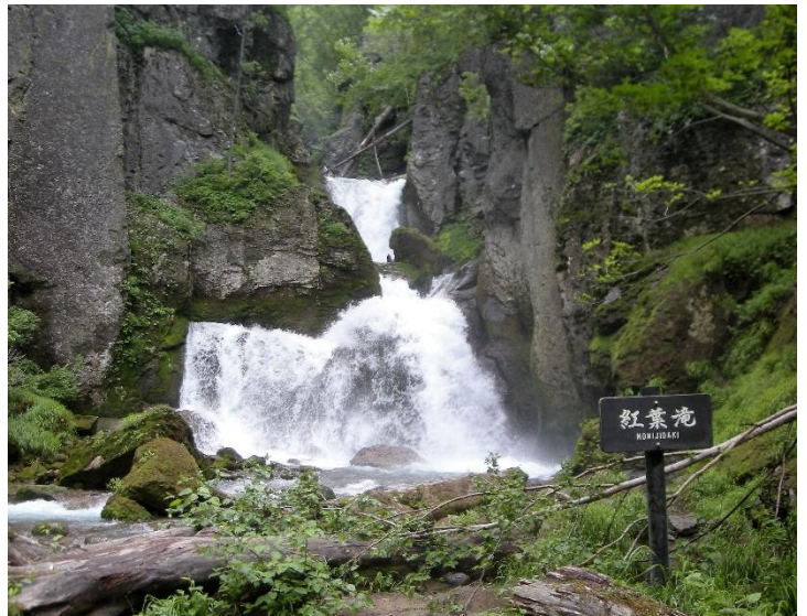
豪快に流れる落ちる紅葉滝