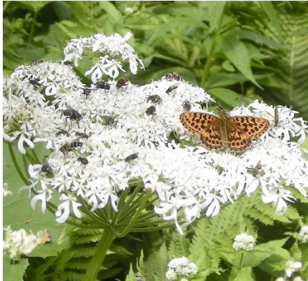
オオハナウドに集まる昆虫