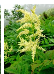
ヤマブキシヨウマ

【残雪状況】七合目標柱を過ぎて4mの雪渓1ヶ所のみ。【開花状況】【七合目】エゾイチゲ・ウコンウツギ・モミジカラマツ【八合目～雲ノ平】ヤマブキシヨウマ・ハクサンボウフウ・ハクセンナズナ・エゾヒメクワガタ・タカネスイバ・エゾノハクサンイチゲ↓・ミヤマキンボウゲ・ジンヨウキスミレ・チシマノキンバイソウ・ハクサンチドリ・クロユリ・キバナノコマノツメ・カラマツソウ・チシマヒョウタンボク・トカチフウロ・エゾイワツメクサ・イワギキョウ・タカネオミナエシ・ヒメイワタデ・ミヤマキンバイ・キバナジャクナゲ・メアカンキンバイ・イワウメ・エゾコザクラ・コマクサ・ジムカデ・イワブクロ・ミネズオウ・エゾツガザクラ・チングルマ・イワヒゲ等