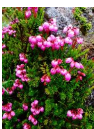
エゾノツガザクラ