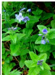
エゾヒメクワガタ