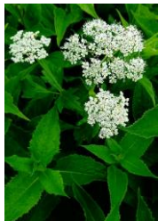
ハクサンボウフウ