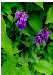
ウズラバハクサンチドリ