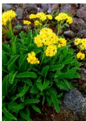
タカネオミナエシ