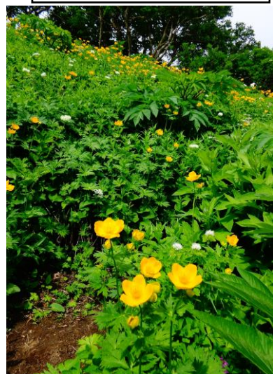
①黒岳八～九合目周辺

ヤマブキシヨウマ・ハクサンボウフウ・ハクセンナズナ・エゾヒメクワガタ・タカネスイバ・エゾノハクサンイチゲ ↓・ミヤマキンポウゲ・ジンヨウキスマレ・チシマノキンバイソウ・ハクサンチドリ・クロユリ・キバナノコマノツ メ・カラマツソウ・チシマヒョウタンボク・トカチフクロ・エゾイワツメクサ・イワギキョウ・タカネオミナエシ・ ヒメイワタデ・ミヤマキンバイ・キバナシャクナゲ・メアカンキンバイ・イワウメ・エゾコザクラ・コマクサ・ジム カデ・イワブクロ・ミネズオウ・エゾツガザクラ・チングルマ・イワヒゲ等