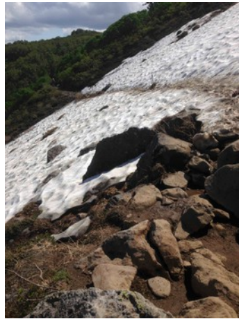
②第一花園看板付近