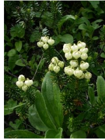
アオノツガザクラ