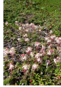
チシマツガザクラ