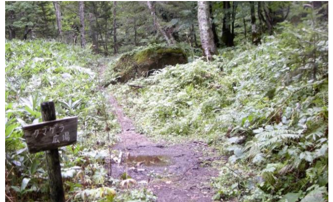
クマゲラ広場：ぬかるみがあります