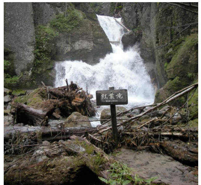
流木が散乱する紅葉滝付近