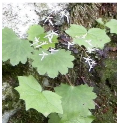
ダイヤモンドソウ