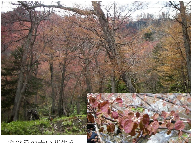
カツラの赤い芽生え