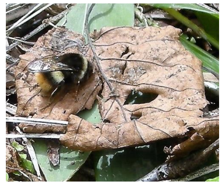
枯葉の上で暖まる