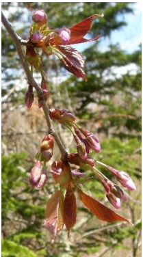
エゾヤマザクラの蕾