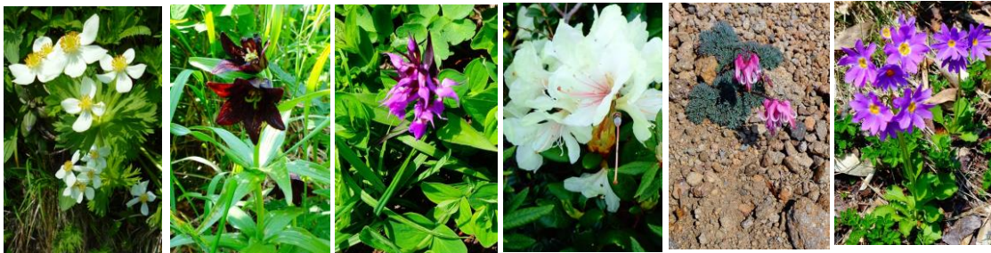
エゾノハクサンイチゲ クロユリ ハクサンチドリ キバナシャクナゲ コマクサ エゾコザクラ

【開花状況】【七～八】ウコンウツギ【八～九】エゾイチゲ・サンカヨウ・ショウジョウバカマ・エゾイワハタザオ・エゾノハクサンイチゲ・ミヤマキンボウゲ・ハクサンチドリ【九～頂】キバナノコマノツメ・ジンヨウキスミレ・チシマヒョウタンボク・カラマツソウ・チシマノキンバイソウ・エゾコザクラ・クロユリ・タカネスイバ・エゾツガザクラ【頂～石室】メアカンキンバイ・エゾイワツメクサ・コマクサ・エゾツガザクラ・チングルマ・タカネオミナエシ・イワウメ・イワヒゲ・ハクサンボウフウ・ミヤマキンバイ・キバナシャクナゲ・ヒメイツツツジ・ジムカデ・エゾコザクラ・ミネズオウ等【残雪状況】気温が上昇し雪どけが進んでいます。但し、スニーカー程度では難しい状況。