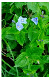
エゾヒメクワガタ