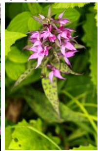
ウズラバハクサンチドリ