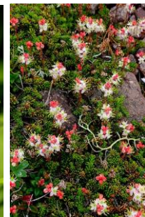
チシマツガザクラ

【開花】【七～雲ノ平】ウコンウツギ・チシマヒョウタンボク・ハクサンボウフウ・ミヤマアキノキリンソウ・チシマノキンバイソウ・ヤマハハコ・コモチミミコウモリ・エゾコザクラ・ヤマブキシヨウマ・カラマツソウ・タカネスイバ・ハクサン(ウズラバ)チドリ・トカチフウロ・エゾノレイジンソウ・エゾヒメクワガタ・ダイセツトリカブト・ヨツバシオガマ・マルバシモツケ・エゾイワハタザオ・メアカンキンバイ・ミヤマキンボウゲ・イワウメ・エゾツツジ・エゾイワツメクサ・コマクサ・イワブクロ・ヒメイワタデ・エゾツガザクラ・チングルマ・タカネオミナエシ・イワヒゲ・イワギキョウ・チシマツガザクラ・サマニヨモギ・ミヤマキンバイ・キバナジャクナゲ・ヒメイソツツジ・ジムカデ・ミネズオウ・ミヤマリンドウ等