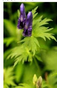
ダイセツトリカブト