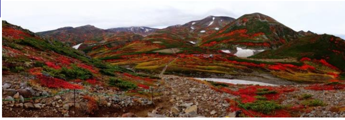
ポン黒岳から石室方面