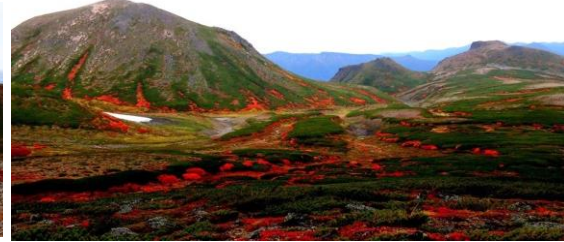
北鎮岳分岐下周辺

【紅葉情報】 さらに色付きが増し、黒岳北東斜面から北鎮岳分岐下、北海沢方面は紅葉の最盛期を迎えています。大雪山系全体的に見頃の状態となりました。(高原温泉は色付き始め) 今年の紅葉は、赤が深く濃い色が出ており特に黒岳九合目周辺のウラジロナナカマドは見事な色付きとなっています。これから数日間の悪天が心配されます・・・。