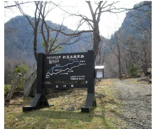
入口付近の雪はありません