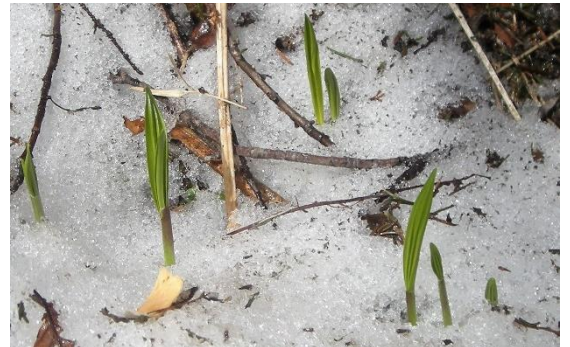
雪から出てきたギョウジャニンニク