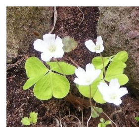
コミヤマカタバミ