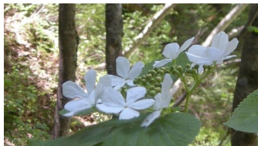
オオカメノキ 柱状節理の看板付近