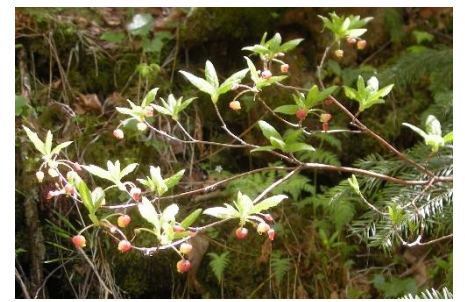
コヨウラクツツジ