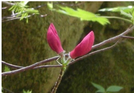
ムラサキヤシオの蕾 咲いているのもあります