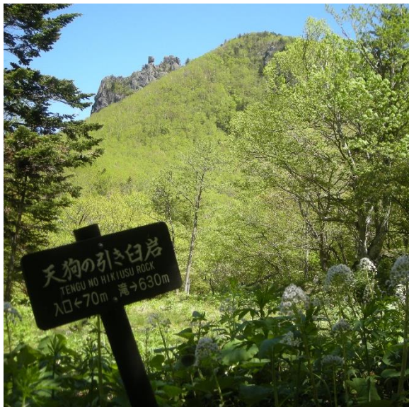
天狗の引き白岩：新緑が上昇中