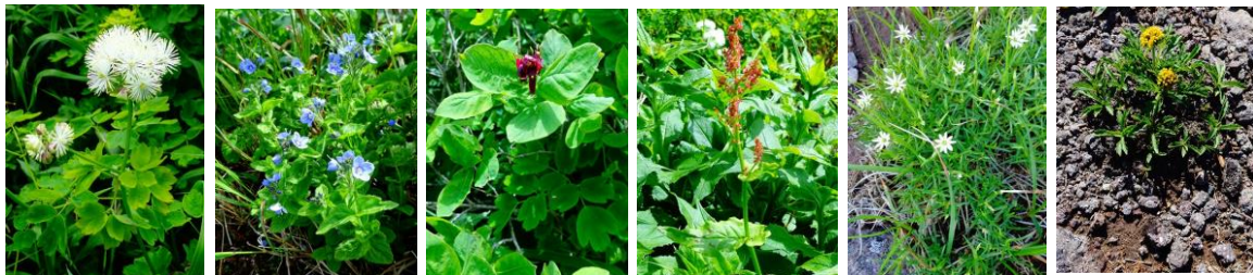
カラマツソウ エゾヒメクワガタ チシマヒョウタンボク タカネスイバ エゾイワツメクサ タカネオミナエシ

【開花情報】【八～頂】ウコンウツギ・キバナノコマノツメ・エゾイワハタザオ・クロユリ・ジンヨウキスミレ・エゾノハクサンイチゲ・エゾイチゲ・ミヤマキンポウゲ・チシマノキンバイソウ・ハクサンチドリ・カラマツソウ・トカチフウロ・ハクサンボウフウ・エゾヒメクワガタ・チシマヒョウタンボク・タカネスイバ 【頂～石室】エゾイワツメクサ・タカネオミナエシ・ヨツバシオガマ・メアカンキンバイ・イワウメ・ミヤマキンバイ・キバナジャクナゲ・ミネズオウ・ヒメイツツジ・エゾツガザクラ・コマクサ・エゾコザクラ・チングルマ等