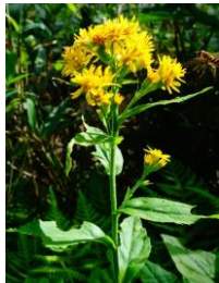
ミヤマアキノキリンソウ