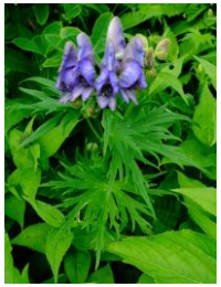
ダイセツトリカブト