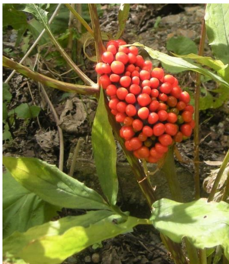
見事な赤い実を付けたマムシグサ