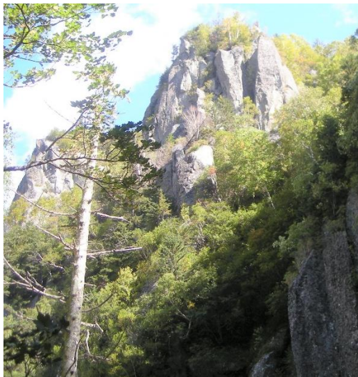
終点の柱状節理、紅葉滝周辺はまだ色づいていません