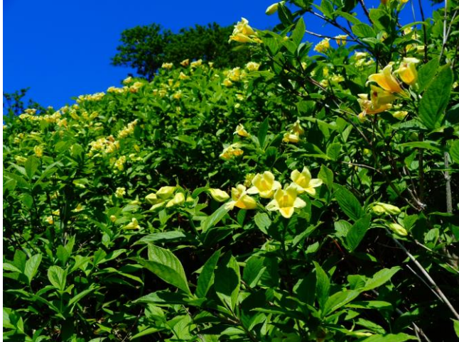
②黒岳八～九合目周辺