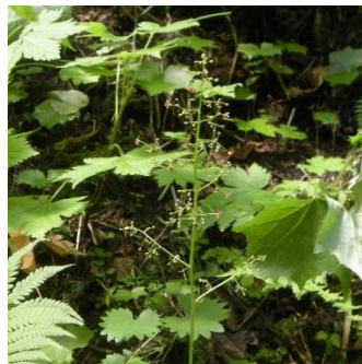
エゾクロクモソウ