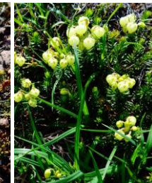
アオノツガザクラ

【開花情報】 ヤマハハコ・カラマツソウ・ハクサンチドリ・ミヤマキンポウゲ・チシマノキンバイソウ・エゾコザクラ・エゾヒメクワガタ・ハイオトギリ・ウコンウツギ・トカチフウロ・ダイセツトリカブト・アザミ類・メアカンキンバイ・イワギキョウ・エゾイワツメクサ・エゾツツジ・イワブクロ・チシマツガザクラ・ミヤマキンバイ・タカネオミナエシ・イワヒゲ・コマクサ・ヨツバシオガマ・エゾツガザクラ・チングルマ・ミヤマリンドウ等