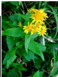
ミヤマアキノキリンソウ