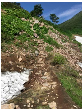
⑤エイコの沢ガレ場

緑岳～板垣分岐: イワブクロ・エゾツツジ・エゾノハコヨモギ↓ チシマギキョウ○ サマニヨモギ↑