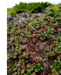
ウラシマツツジ・ほんのり赤く

【開花情報】コモチミミコウモリ・ハクセンナズナ・ヤマハハコ・カラマツソウ・ミヤマキンボウゲ・チシマノキンバイソウ・エゾコザクラ・ハイオトギリ・トカチフウロ・ダイセツトリカブト・アザミ類・メアカンキンバイ・イワギキョウ・エゾイワツメクサ・イワブクロ・ウスユキトウヒレン・チシマツガザクラ・ミヤマキンバイ・イワヒゲ・コマクサ・ヨツバシオガマ・エゾツガザクラ・アオノツガザクラ・チングルマ・ミヤマリンドウ等