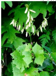
コモチミミコウモリ