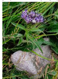
ウスユキトウヒレン