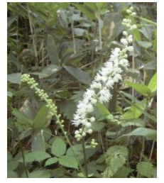
サラシナショウマ