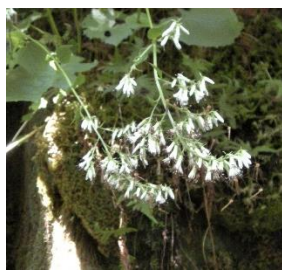
コモチミミコウモリ