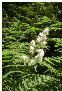
ホザキナナカマド