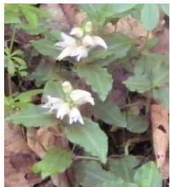
アケボノシュスラン