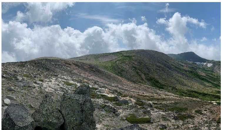
⑥ 山頂からの小泉岳・白雲岳方面

⑤第四雪渓は、雪渓、雪解け水の流入共になく比較的歩きやすいですが、泥の部分は滑りやすいので注意してください。また、小石の上や砂利も足を取られやすいです。気を付けてください。⑥山頂付近では、アオノツガザクラやミヤマリンドウ、クモイリンドウなどが咲いています。山頂付近は風が強いこともあるため、強風に注意してください。少しずつ、植物の葉も色づいてくる季節になりました。ただ、第四雪渓や山頂付近では、もう少しだけ高山植物のお花を楽しむことができそうです。