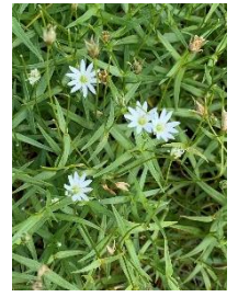
エゾイワツメクサ

【コマクサ平】 エゾウメバチソウ、ハクサンボウフウ 【赤岳山頂】 イワブクロ、クモイリンドウ、エゾイワツメクサ、ミヤマリンドウ、イワギキョウ