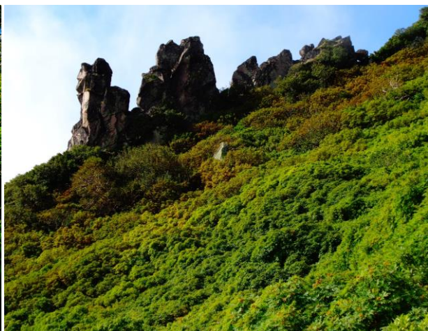
②黒岳九合目周辺マネキ岩