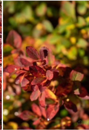
ヒメクロマメノキ