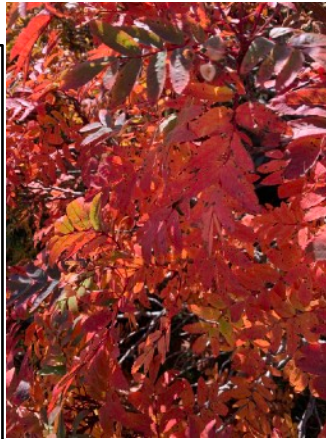
ウラジロナナカマド