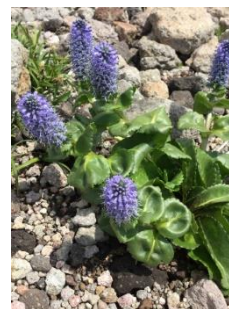
ホソバウルップソウ