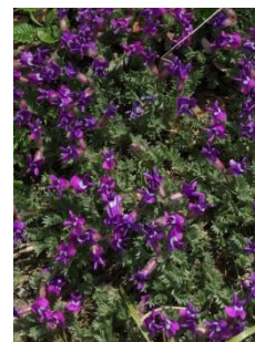
エゾオヤマノエンドウ