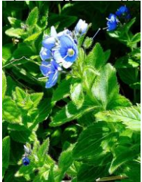
エゾヒメクワガタ