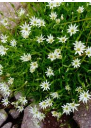
エゾイワツメクサ