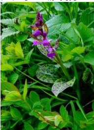
ウスラバクサンチドリ