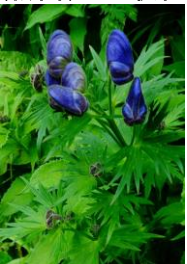
ダイセツリカブト