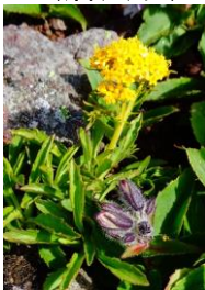
タカネオミナエシ