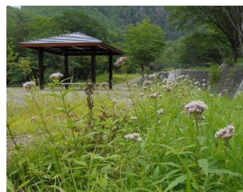
ヨツバヒヨドリとあずまや