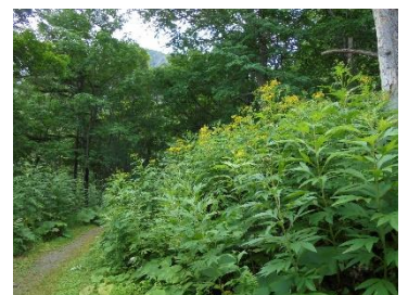
1mを超えるハンゴンソウ