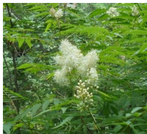
ホザキナナカマド