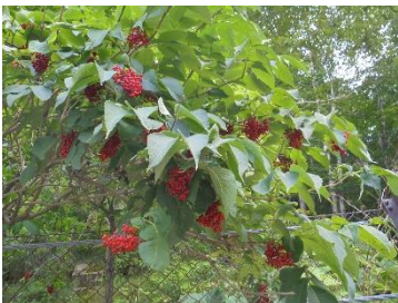
エゾニワトコの赤い実