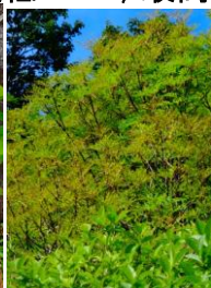
色が抜けてきたウラジロナナカマド