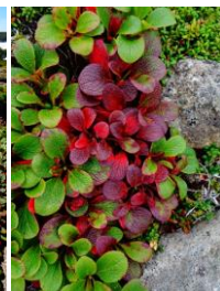
草紅葉・ウラシマツツジ

【開花情報】【八合目～雲ノ平】 コモチミコウモリ・モミジカラマツ・マルバシモツケ・エゾウサギギク・エゾノレイジンソウ・カラマツソウ・ヤマブキシヨウマ・エゾヒメクワガタ・トカチフクロ・ハクサンチドリ・ミヤマキンボウゲ・エゾコザクラ・チシマノキンバイソウ・ダイセツトリカブト・オニシモツケ・タカネトウチソウ・タカネスイバ・ハクサンボウフウ・ミヤマアキノキリンソウ・ハイオトギリ・アザミ類・イワギキョウ・エゾイワツメクサ・イワブクロ・ミヤマキンバイ・イワヒゲ・コマクサ・ウスユキトウヒレン・エゾツガザクラ・チングルマ・チシマツガザクラ等