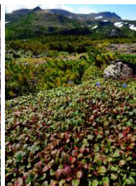
草紅葉・ウラシマツツジ