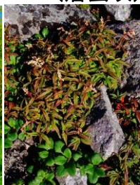
草紅葉・ヒメイワタデ