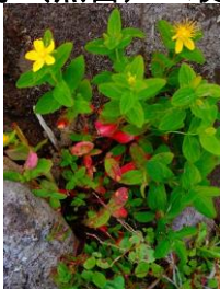
草紅葉・ハイオトギリ