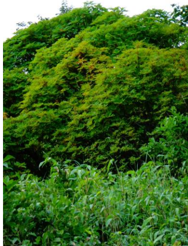
①黒岳七・八合目周辺