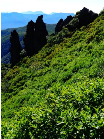
②黒岳九合目・まねき岩周辺