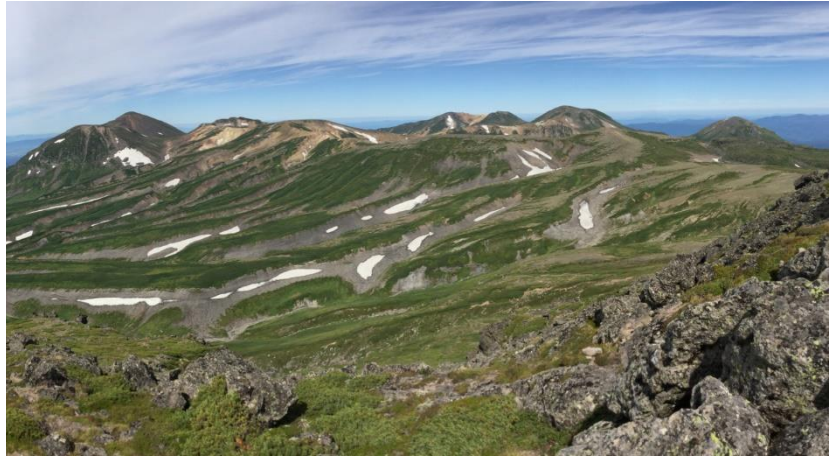
白雲岳山頂から旭岳方面の展望