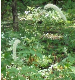
サラシナショウマ