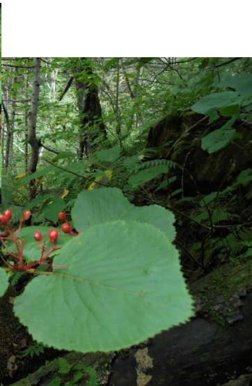
ウスノキの実 (上) オオカメノキの実 (下)