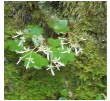
ダイヤモンドソウ