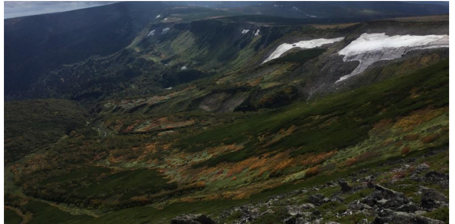
岩塊斜面上部から高根ヶ原方面を遠望