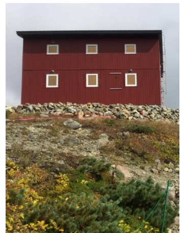
⑧白雲岳避難小屋外観